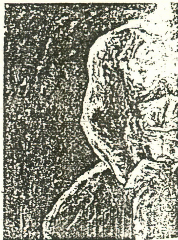
楊克勤 人體局部 莊畫 100×90cm