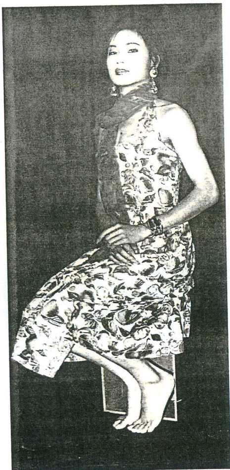
馬六明《芬·馬六明》之三 1993 中國北京