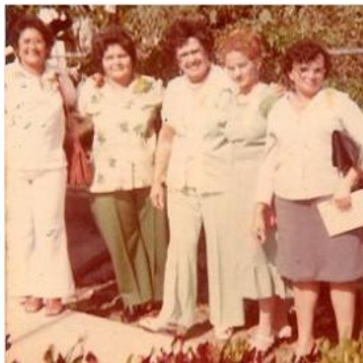
Fig. 7: Fundadoras de A.M.E.P.A. 22