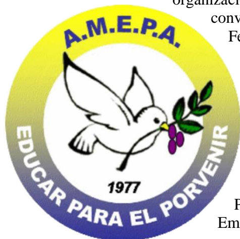
Fig. 6: Símbolo y lema de A.M.E.P.A. 21